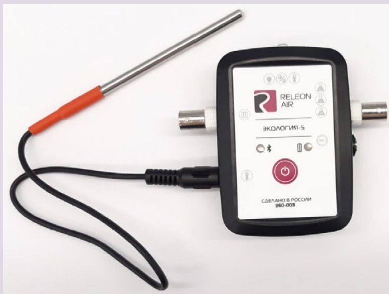
Рис. 6. Датчик температуры растворов

Датчик температуры термопарный предназначен для измерения температур до 900. Используется при выполнении работ, связанных с измерением температур плавления и разложения веществ, а также для измерения температуры в экзотермических процессах.