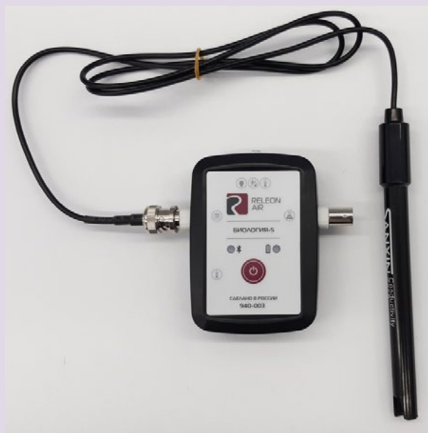
Рис. 5. Датчики электропроводимости

Датчик электропроводимости — предназначен для регистрации и измерения удельной электропроводности жидких сред, в том числе и водных растворов веществ. Применяется при изучении характеристик водных растворов, в том числе почвенных вытяжек.