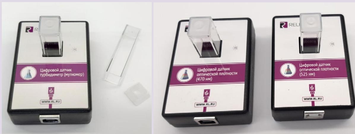
Рис. 8. Датчики мутности (слева), оптической плотности на 465 нм (в центре) и 525 нм (справа)

В комплект входят датчики с различной длиной волн полупроводниковых источников света: 465 и 525 нм. Диапазон измерения коэффициента пропускания света: от 0 до 100 %. Разрешение при измерении коэффициента пропускания: 0,1 %. Диапазон измерения оптической плотности: от 0 до 2 D. Разрешение при измерении оптической плотности: 0,01 D. Длина оптического пути кюветы: 10 мм. Объём кюветы: 4 мл. Технологические особенности: требуется хорошо промывать кювету для исследуемого раствора.