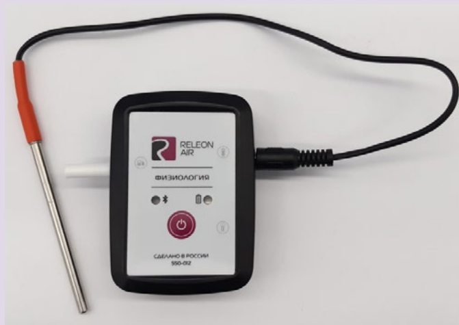
Рис. 12. Датчик температуры тела

Датчик температуры тела — предназначен для непрерывного измерения температуры тела в подмышечной впадине. Оснащён выносным зондом. Диапазон измерения: от 25 до 50 °С. Разрешение датчика: 0,1 °С. Технологическая особенность: для точного измерения в подмышечной впадине должна находиться вся металлическая часть зонда.